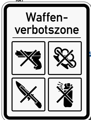
WV1 reflektierend RA1