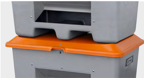
Stapelbar mit geschlossenem Deckel