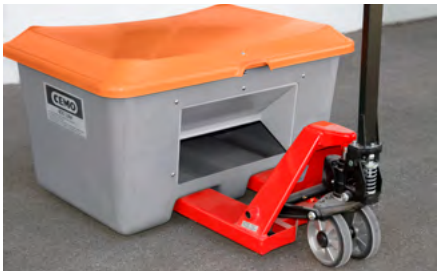
Unterfahrbar mit Hubwagen und Gabelstapler